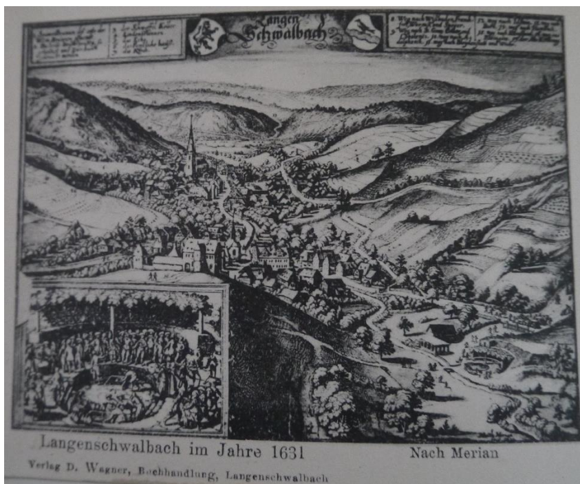
Stadtansicht von Langenschwalbach nach Merian mit alter Elisabethkirche mittig im Bild

Da sich die Zahl der Katholiken – vor allem auch durch den Aufschwung des Kurwesens – gerade im ausgehenden 18. Jahrhundert stark vergrößerte, entschloss man sich zu einem Neubau der Kirche. Eine Sanierung des alten Gebäudes kam wirtschaftlich gesehen nicht in Betracht.