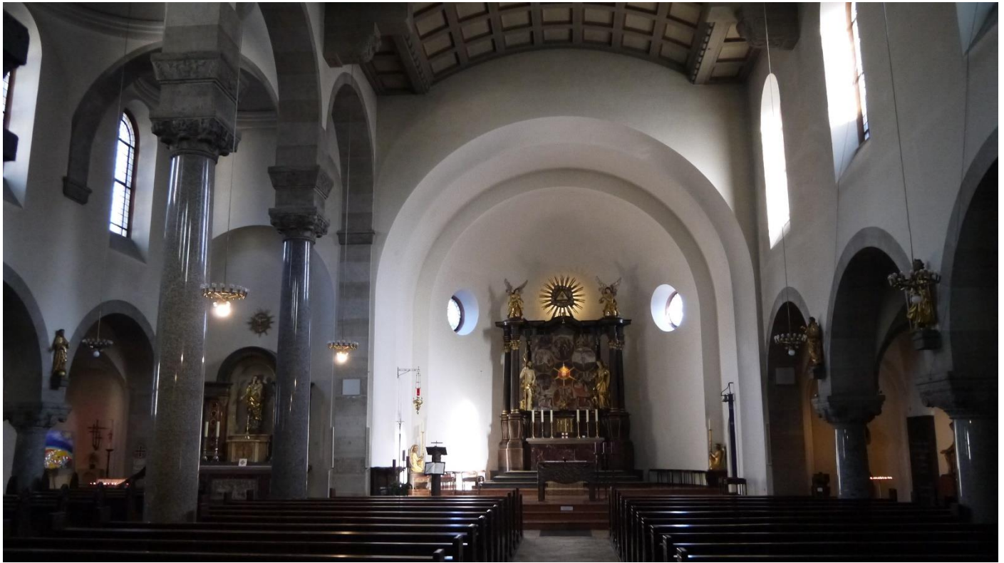
Heutiger Blick in den Innenraum von St. Elisabeth

Bis auf das Hinzufügen des Volksaltars im Jahr 1978 wurden seitdem keine nennenswerten Änderungen vorgenommen. 1993 fand eine erneute Innenrenovierung statt, in den Jahren 2002-2004 eine Außenrenovierung.