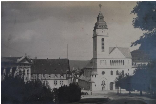
Blick auf St. Elisabeth ohne Uhr und Mosaik (Aufnahme um 1950)

Aufgrund von Geldmangel wurde nur das Mittelstück des neuen Hauptaltars fertiggestellt; ebenso blieb die Kirche im Inneren zunächst unverputzt. Ihr Geläut konnte erst 1954 auf vier Glocken vervollständigt werden.