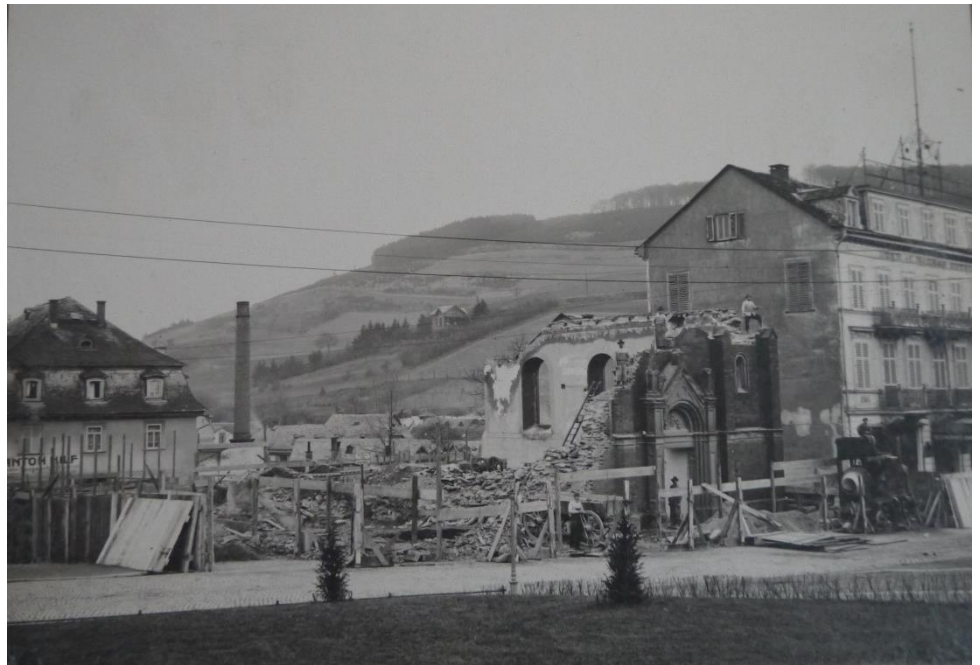
Alte Elisabethkirche und deren Abriss

Die Vorgängerkirche wurde dabei abgerissen und auf demselben Grundstück die heutige Kirche gebaut. Dabei nutzte man die vorhandene Fläche bestmöglich aus; der ehemalige Friedhof und ein Stück des Kirchhofes wurden zur Baufläche hinzugezogen. Das Bauprojekt stieß auf großen Widerstand. Vor allem der damalige Bürgermeister hätte lieber ein Hotel statt einer neuen Kirche in dieser bevorzugten Lage gesehen.