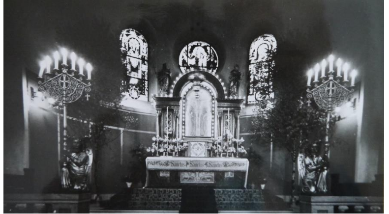
Entwurf des Hochaltars und dessen teilweise Umsetzung (Mittelstück) als realisierter Hochaltar

Aufgrund von Geldmangel wurde nur das Mittelstück des neuen Hauptaltars fertiggestellt; ebenso blieb die Kirche im Inneren zunächst unverputzt. Ihr Geläut konnte erst 1954 auf vier Glocken vervollständigt werden.