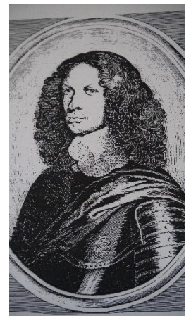
Landgraf Ernst von Hessen-Rheinfels-Rothenburg

Erst nach der Konversion des Landgrafen Ernst von Hessen-Rheinfels-Rothenburg wurde die Ausübung katholischen Glaubens wieder möglich. Die 1658 der heiligen Elisabeth geweihte Kirche war ein von Kurfürst und Erzbischof Johann Philipp von Schönborn finanzierter Bau. Zu dieser Zeit gehörte Langenschwalbach zum Erzbistum Mainz.